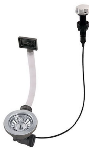
自动下水 8407 000