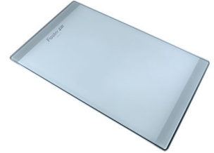
玻璃砧板 8631 300