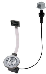
自动下水器 LIRA 8407 103