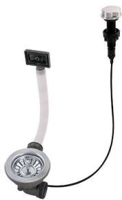
自动下水 8407 100